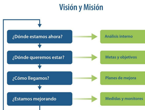
Figura 2. Modelo de mejora continua

Se propone tomar en cuenta un modelo de mejora continua que contemple los siguientes puntos: