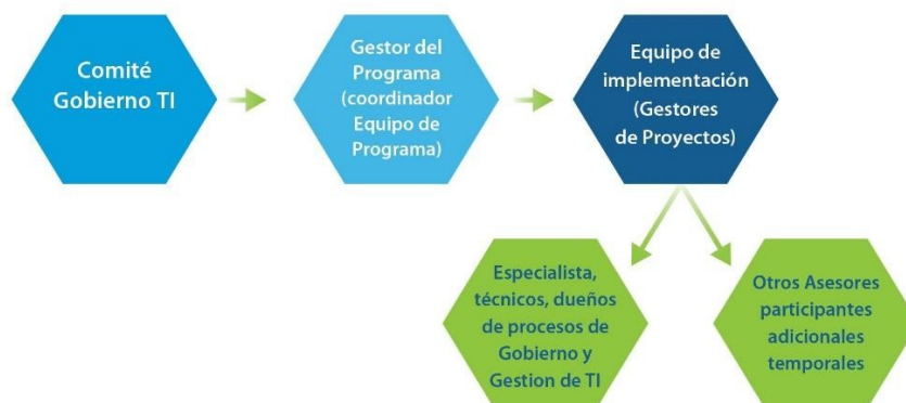
Figura 3. Equipo del Programa de implementación del Marco de Gobierno de TI