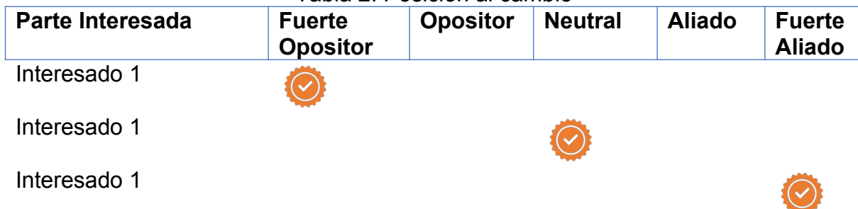
Tabla 2. Posición al cambio

Se deben entender las razones por las cuales las partes interesadas de alta influencia apoyan o rechazan la iniciativa. Entre más claras estén las razones, más fácil será desarrollar una estrategia para gestionar el cambio organizacional.